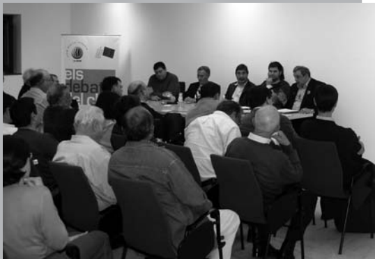
Debats i xarrades: a la imatge, al Club Diario Levante.