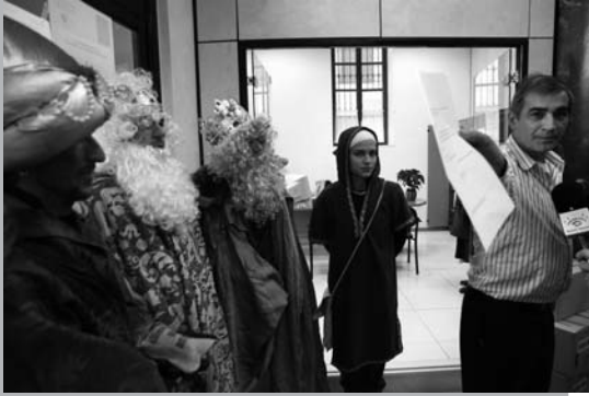
Gener de 2006: "El alcalde de Vilallonga llama pallasos a los reyes magos contrarios al golf" ( Las Provincias )