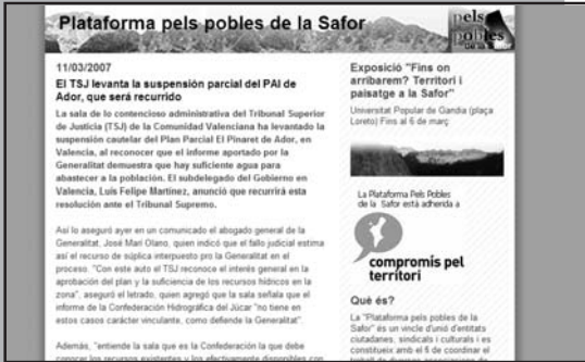
Un espai d'informació i debat obert a tot el món, a Internet.