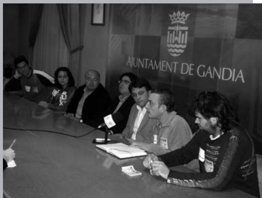
Hem buscat consensos per treballar per la salut de les persones: reunió amb l'Ajuntament de Gandia, donant suport al recurs de barxeta i a la manifestació contra l'alta tensió a aquesta localitat.